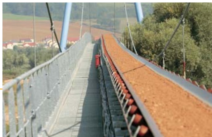
▲ Pont suspendu sur la Moselle permettant le transfert par convoyeur à bande depuis l'extraction de Blénod vers les installations de Loisy

■ Cette politique présente des avantages significatifs pour les partenaires de GSM :