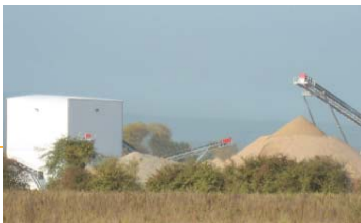
▲ Les installations de traitement de Yutz (57)