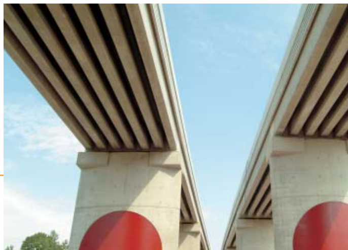
▲ Les produits de GSM Lorraine ont été utilisés pour la réalisation de la LGV Est