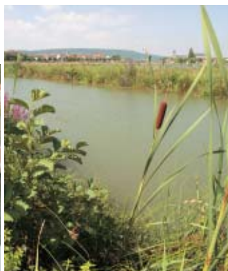
▲ Les travaux de réaménagement de Pont-à-Mousson (entrée sud) ont permis de reconstituer 2 types d'espaces : une zone portuaire et une zone écologique