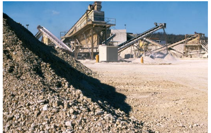
▲ La carrière du Subdray

La production des carrières de GSM Centre est majoritairement orientée vers la filière BPE (Béton Prêt à l'Emploi) et les matériaux produits répondent aux normes de qualité requises pour le développement des bétons haute performance, la réalisation d'ouvrages d'art et la fabrication de produits en béton.