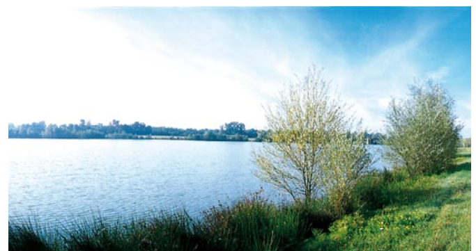
▲ Le réaménagement de la sablière de Vierzon