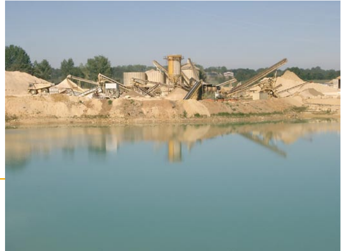
▲ La carrière de Saint Maurice la Clouère