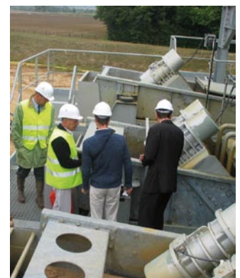
▲ Visite du site de Preuilley