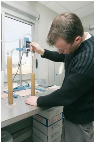
▲ Laboratoire de Preuilley

Les laboratoires de contrôle qualité du secteur garantissent aux clients la fiabilité du produit fini. Toutes les carrières du secteur centre sont certifiées CE 2+, les produits de la carrière de Preuilley bénéficient également de la certification NF.