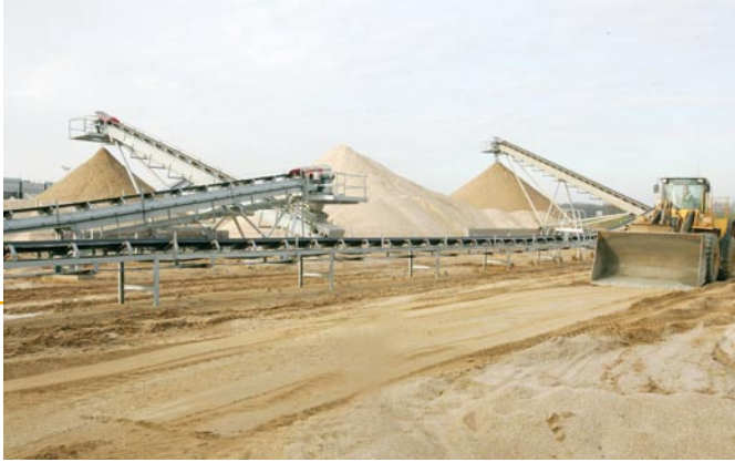
▲ La sablière de Preuilley