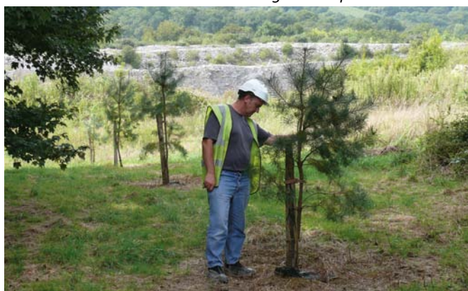
▲ Suivi des plantations sur le site d'Arancou