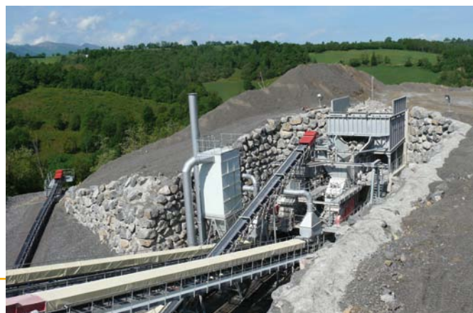
▲ Nouvelles installations de Rébénacq