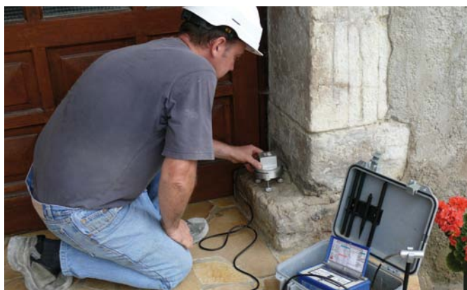
▲ Le sismographe permet de contrôler les vibrations engendrées par les tirs de mine

A titre d'exemples, sur le thème du réaménagement, la sablière de Baliros dont l'exploitation s'est achevée en 2009 a été reboisée en faisant appel à l'expertise de l'ONF ; sur le site d'Aressy, au fur et à mesure de l'avancée de l'exploitation, les berges du lac sont progressivement réaménagées et remises à la disposition de la collectivité.