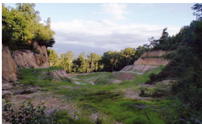
▲ Le réaménagement du site de Baliros allie étroitement reconstitution forestière et intégration paysagère