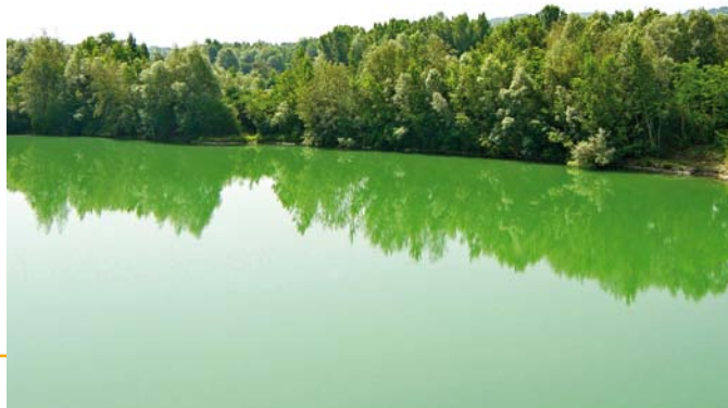
▲ Lac d'Aressy