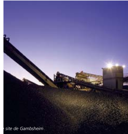
site de Gamsheim

Parmi les nombreux réaménagements réalisés par GSM-Alsace sur l'ensemble de ses sites, des procédés de végétalisation protègent les berges par des plants pour empêcher l'érosion (plantation de boutures de saule et engazonnement ou géotextile par toile biodégradable). Se considérant avant tout comme un invité de la commune, GSM-Alsace respecte le territoire d'accueil et reste vigilant à l'intégration du site exploité dans son environnement. De nombreuses visites de carrières pour les riverains et les écoles sont réalisées et des liens étroits avec les communes sont maintenus en permanence.