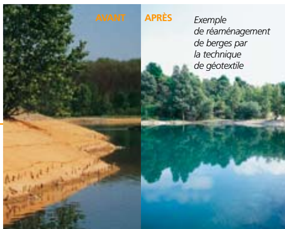
Exemple de réaménagement de berges par la technique de géotextile