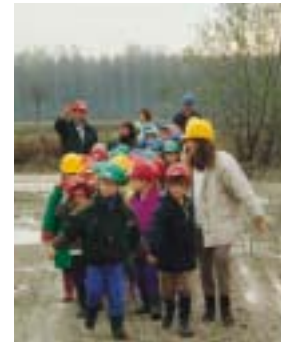
Visite de site par les écoliers