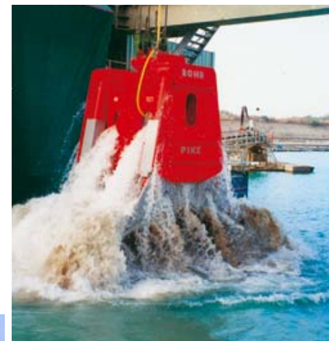
La drague de Rumersheim et son grapin d'une capacité de 10m 3 .