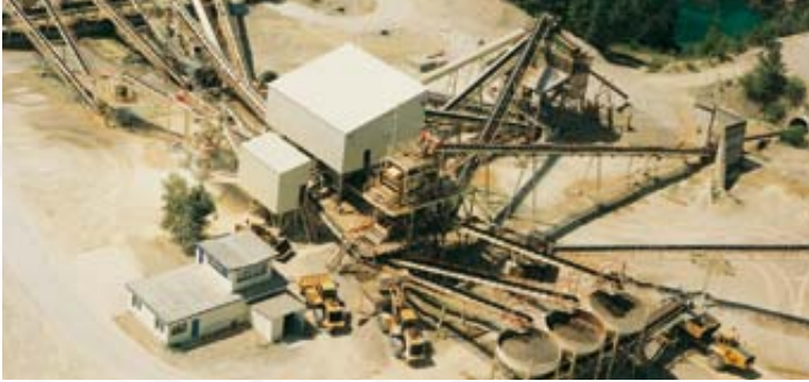
Carrière de Rumersheim : Dotée d'un outil de production certifié ISO 9002, la carrière de Rumersheim est un des fleurons du secteur GSM-Alsace.