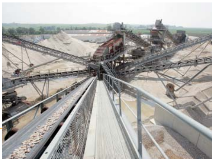
▲ La carrière des Monards (17)

■ Dans un souci de gestion économe et rationnelle de la ressource, GSM Pays de la Loire a décidé d'orienter sa production vers des matériaux de substitution que sont les matériaux de terrasse. Cette politique de diversification permet de répondre aux besoins des clients en leur assurant un approvisionnement sur le long terme.