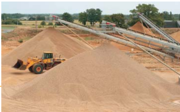
▲ La carrières des Alleuds (49)