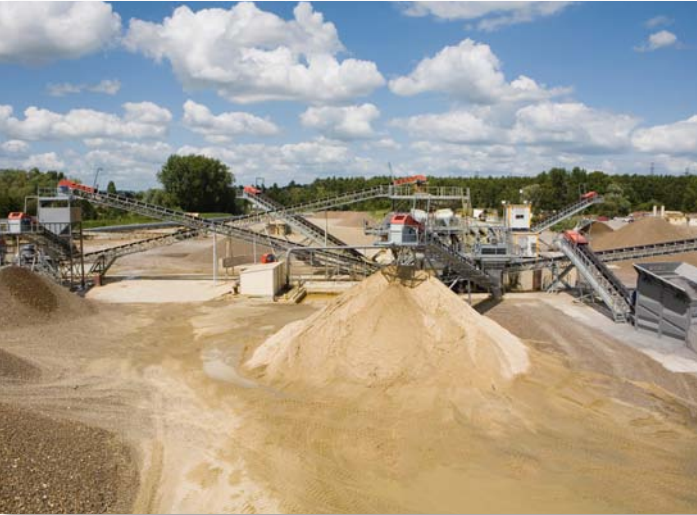
▲ Nouvelles installations de La Frette.