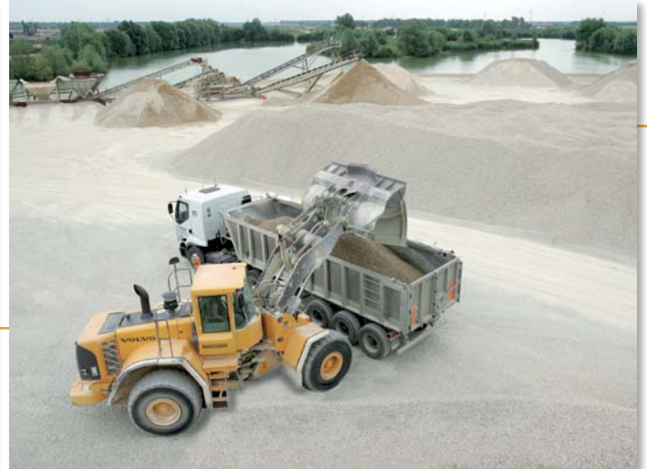
▲ Chargement client sur le site de Matignicourt-Goncourt .