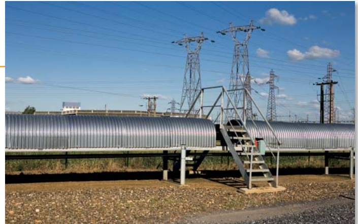
▲ La construction d'une bande transporteuse de 2,5 km pour acheminer les matériaux depuis la carrière jusqu'à l'installation de Tergnier-La Frette a permis de supprimer le trafic routier entre ces 2 sites.

■ Cette politique présente des avantages significatifs pour les partenaires de GSM :