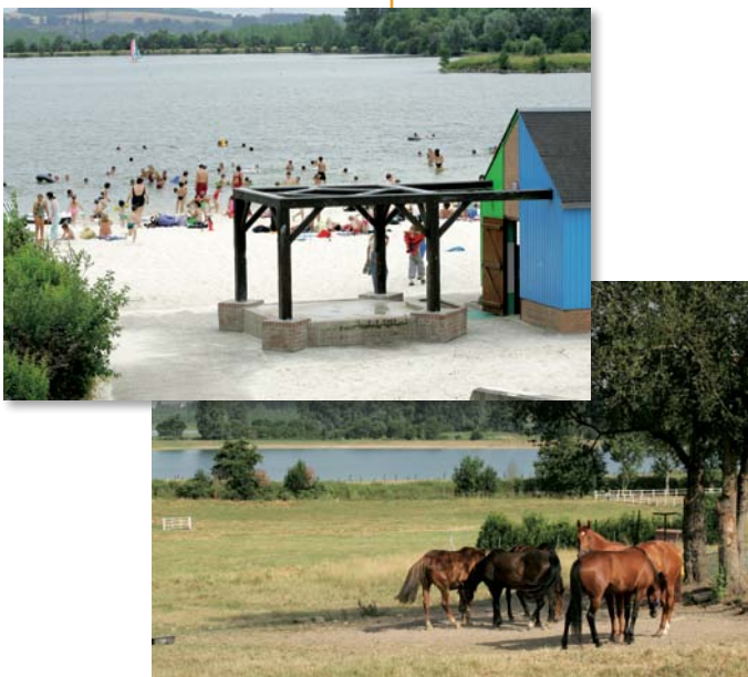
▲ Les travaux de réaménagement sur les sites de Tergnier-La Frette et Travecy ont permis respectivement de créer l'un des espaces de loisirs les plus fréquentés de l'Aisne et de constituer une zone naturelle.