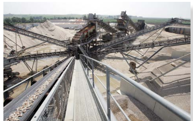
▲ Installation de traitement des Monards (17)

GSM s'appuie sur le dispositif de Sablimaris, filiale de DTM, gérée en partenariat avec le groupe Libaud. Les quatre sites, situés à Quimper (29), Lorient (56), les Sables d'Olonne (85) et La Pallice (17), traitent les granulats marins en provenance des gisements au large de l'Estuaire de la Loire, de la Vendée et des Charentes Maritime exploités par le bateau André L, le plus performant de la flotte sablière française, et le Penfret.